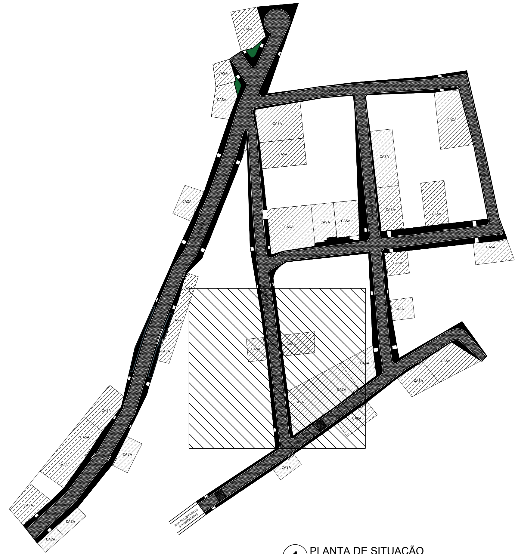
1 PLANTA DE SITUAÇÃO ESCALA 1/1000